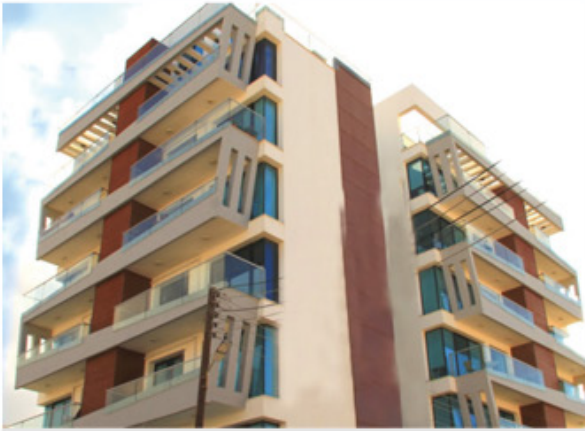
North Crown Residence Girne