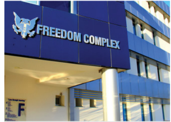
GAÜ Freedom Complex Girne