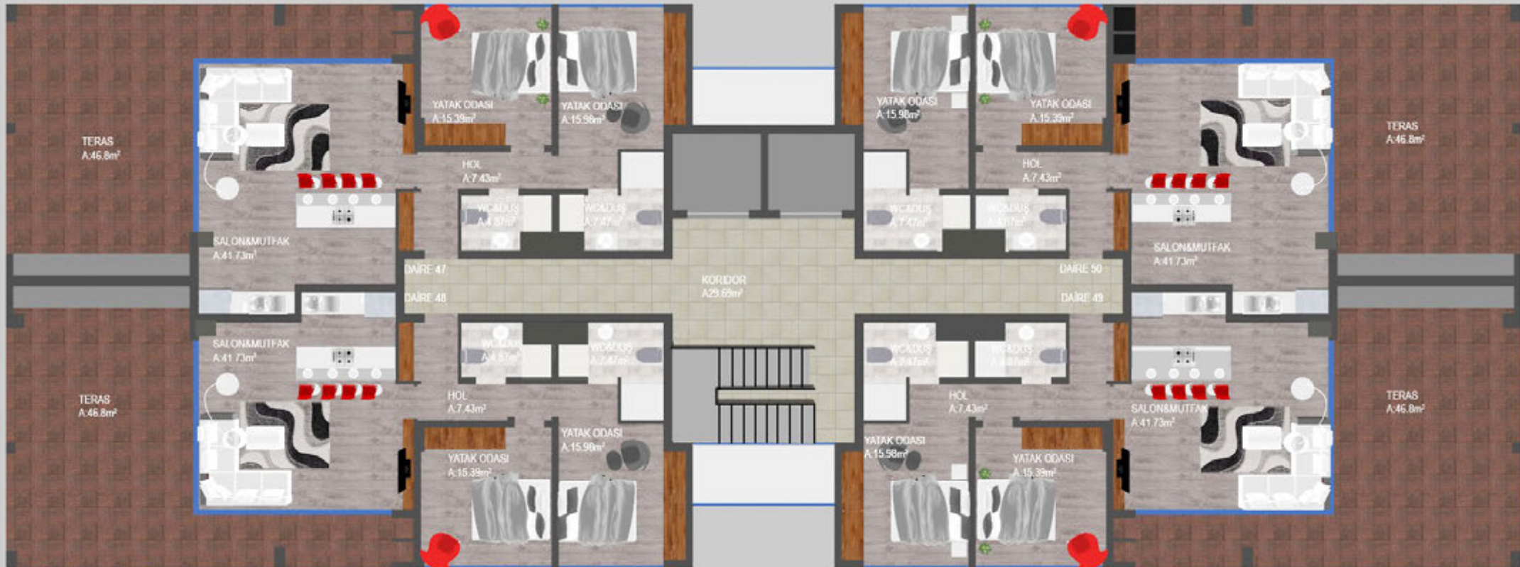
YEDINCI KAT PLANI