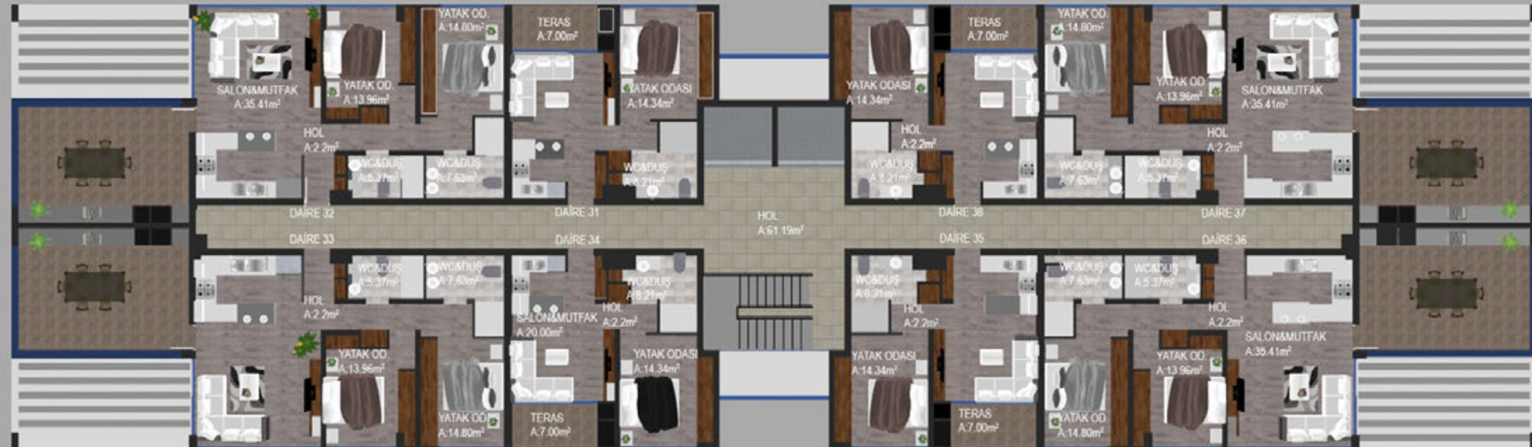
DÖRDÜNCÜ KAT PLANI