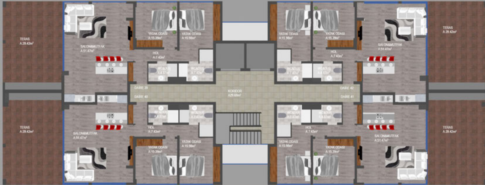
BEŞİNCİ KAT PLANI