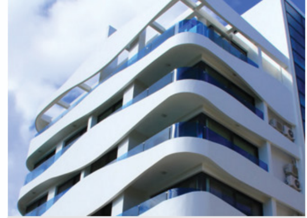
HİS Crown Residence Girne