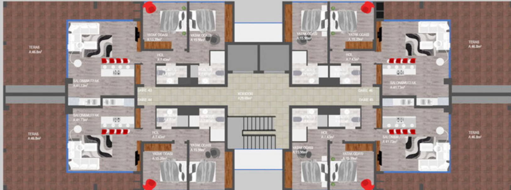
ALTINCI KAT PLANI