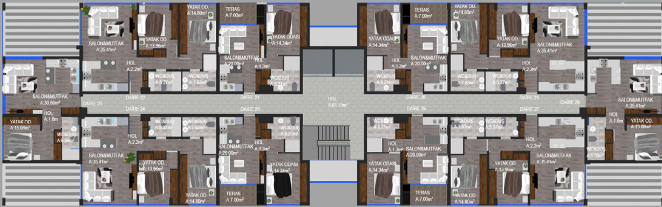
ÜÇÜNCÜ KAT PLANI