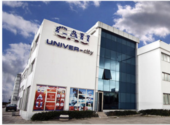
GAÜ Univercity Complex Girne