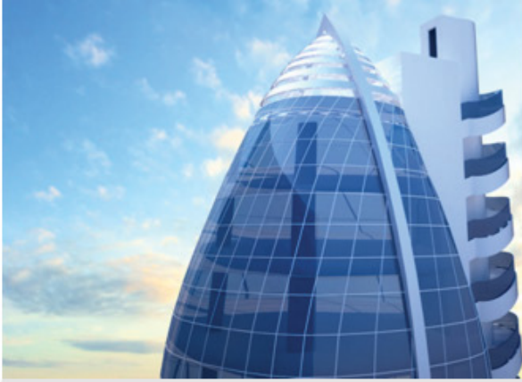
M Tower Lefkoşa