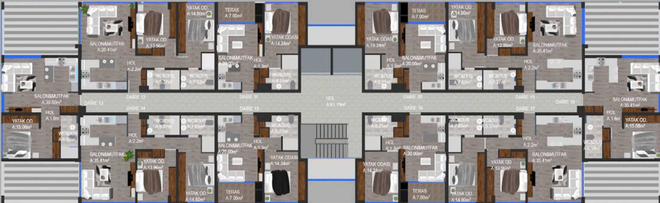
İKİNCİ KAT PLANI