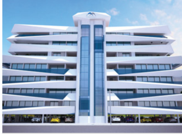
Royal Suites Girne